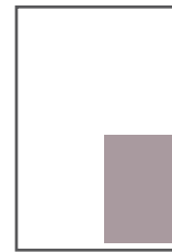
1/4 Seite 2-spaltig