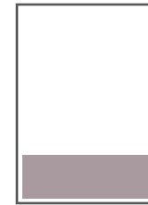
1/4 Seite quer