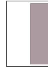
1/2 Seite hoch