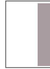
1/3 Seite hoch