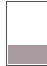
1/3 Seite quer